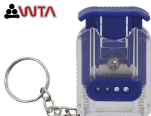
Herramienta para cortar pajillas que contienen semen.