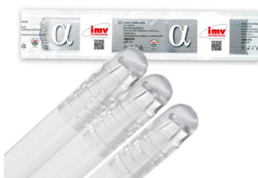
Vaina Alpha: Depósito preciso, distribución perfecta. Se adapta a todo tipo de pajuela.