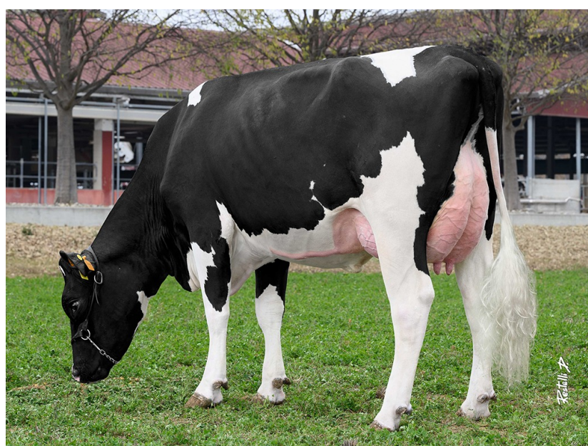
Fugazza Stealth Ricca Fugazza Holsteins; Italy