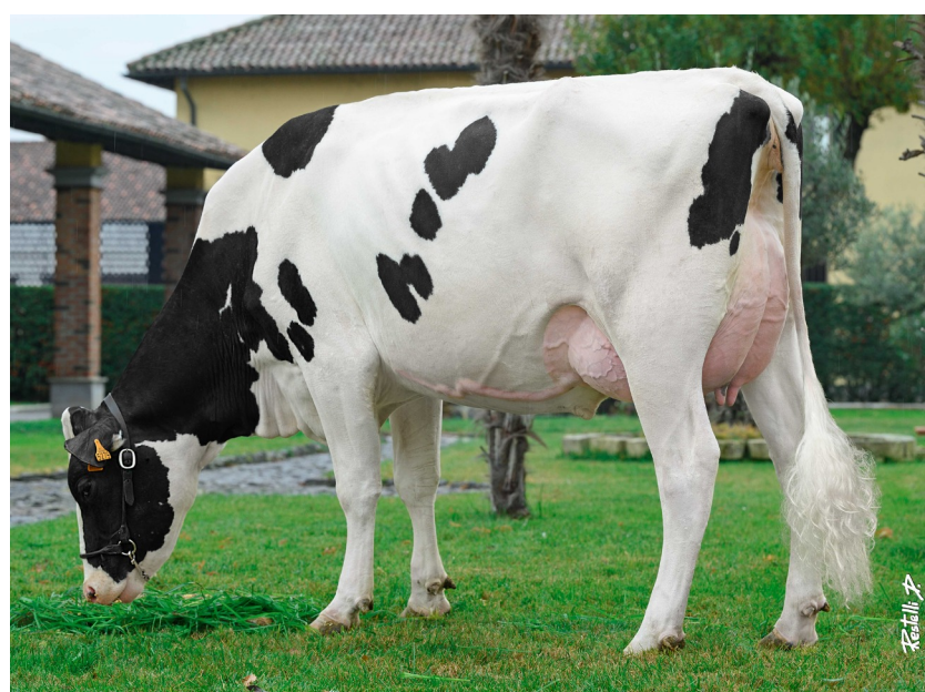
Le Cascine Stealth Serena Coop. Le Cascine; Italy