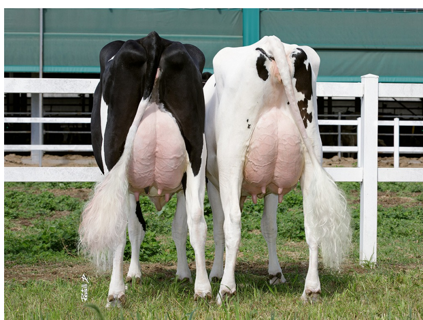
Go-Farm Klaebo 30 and 873 Go-Farm di Gozzini; Italy