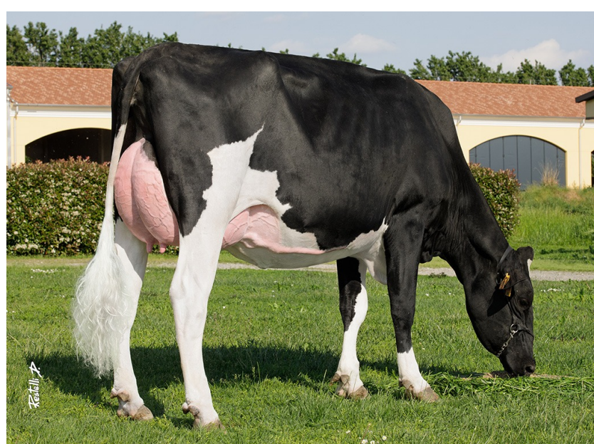
Grungni Klaebo 2818 Grungni Holsteins; Italy